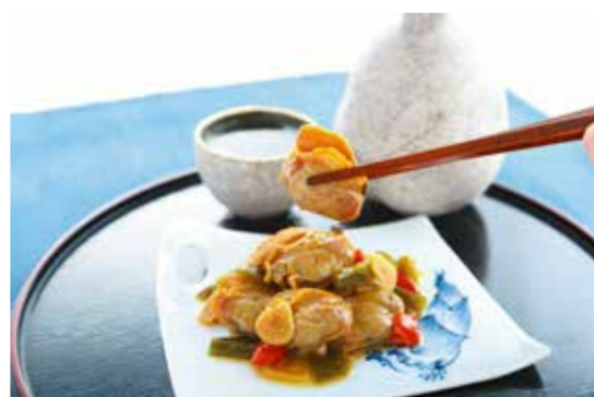
2019一般部門審査員特別賞 株式会社アンドヒューマン 市川三番瀬の幸 煮貝の酔っぱらい漬 ホンビノス貝