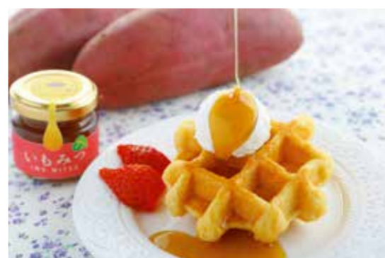
2019直売所部門金賞 株式会社いっぷく堂 いっぷく堂のいもみつ