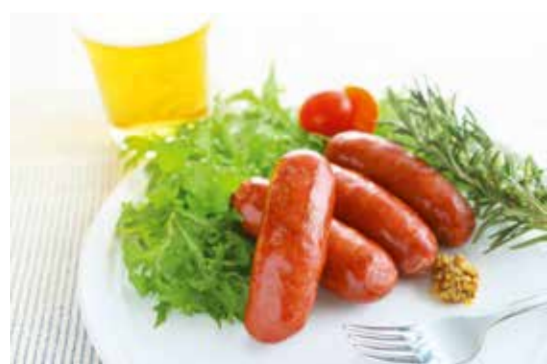
2019一般部門金賞 株式会社 厨房 MITO Kiyomidai Café 天然・猪フランク