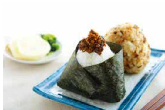
2019一般部門銀賞 有限会社アルガマリーナ 房州さば山椒 ひじき入り