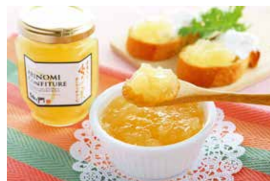
2019直売所部門金賞 有限会社与佐エ門 ありの実コンフィチュール

7月～9月の間に、LED照明器具（シーリングライト又はペンダントライト）に買い替えた家庭を対象に、抽選で50名様に「食のちばの逸品を発掘2019」受賞品を差し上げます。