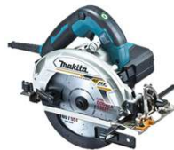
※ヒール・サンダル不可

丸のこの様々な機能を座学と実践を交えながらお伝えしていきます。少人数制で一一人丁寧に説明しますので、初めての方でも安心して挑戦していただけます。