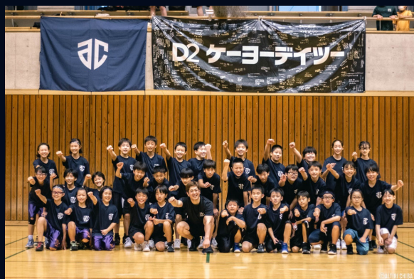
22年8月12日 大網白里市 開催