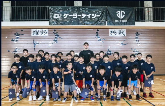
22年7月17日 千葉市(磯辺) 開催