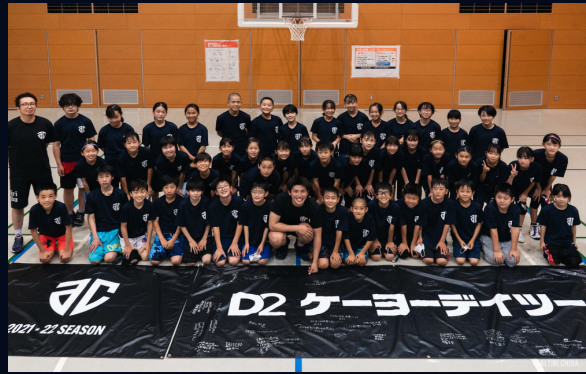
22年6月18日 印西市 開催