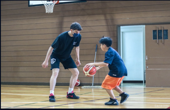
↓選手と一緒に練習し、プロのプレーを目の当たりにしました。