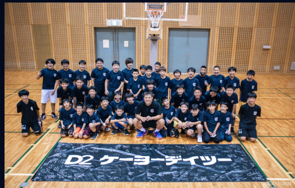
22年7月30日 千葉市(ポートアリーナ) 開催