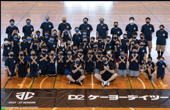
【開催日程：全6回】 21年8月1日 富津市 開催