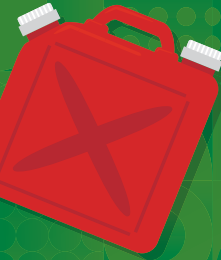
ポリタンク (灯油缶、水缶)

「埼玉県プラスチック資源の持続可能な 利用促進プラットフォーム」の実証事業にご協力ください。