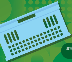
収穫用コンテナ、RVボックス、 ビールケース