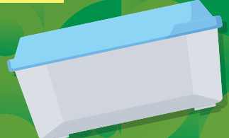
衣装ケース (フタ式、引出式など)